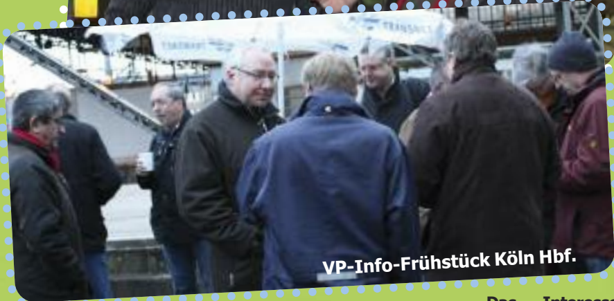
VP-Info-Frühstück Köln Hbf.

beschäftigten. Unterschiedliche Fragen und Probleme konnten so erörtert werden. Themen waren u. a. die konkrete Arbeitssituation, ein mögliches Job-Ticket, beamtenrechtliche Fragen. In den Mitgliederversammlungen am Nachmittag standen ebenfalls ganz konkrete Fragen zur aktuellen Gewerkschaftspolitik, aber eben auch zum Prozess „Werkstatt Gewerkschaft“ im Mittelpunkt.