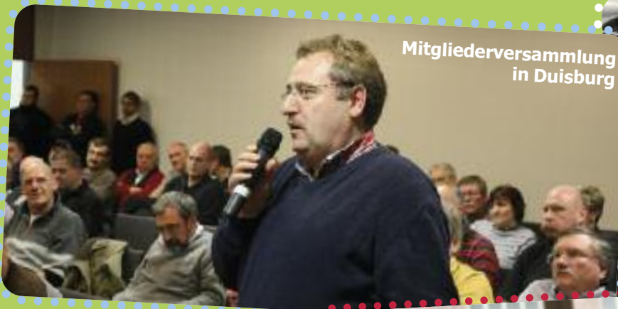
Mitgliederversammlung in Duisburg