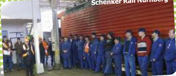
Schenker Rail Nürnberg