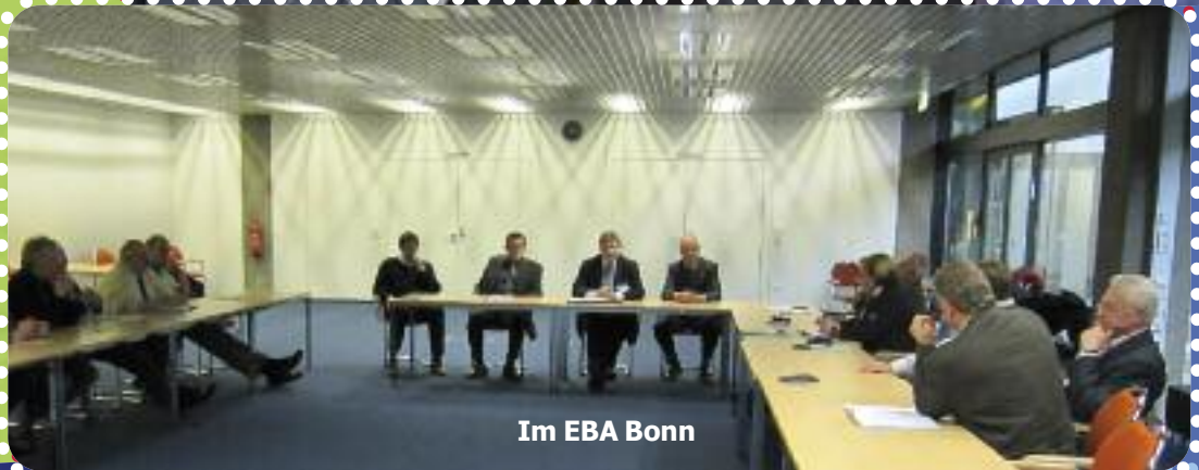
Im EBA Bonn