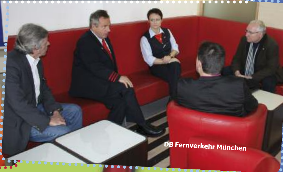
DB Fernverkehr München