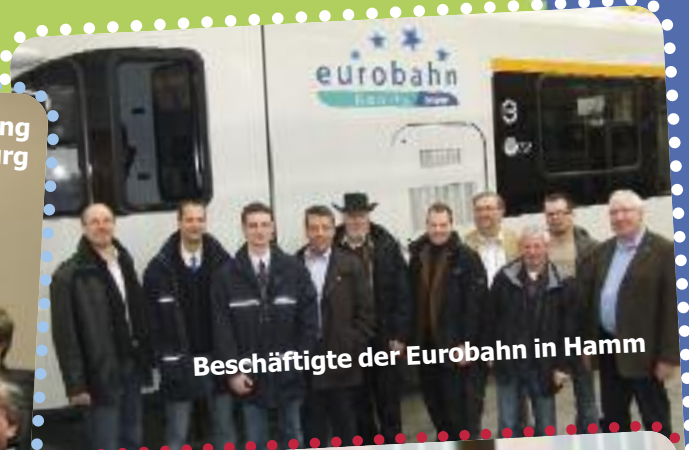
Beschäftigte der Eurobahn in Hamm

Als Antwort darauf haben TRANSNET und GDBA das Konzept eines Branchentarifvertrages für die Schiene entwickelt. Wegen der besonderen Situation der SPNV-Branche (Ausschreibungswettbewerb!) soll dieser Branchentarifvertrag zunächst für diesen Bereich abgeschlossen werden, ohne dass die anderen Bereiche darüber vernachlässigt werden. Der Abschluss eines Branchentarifvertrages hat für TRANSNET und GDBA in diesem Jahr politische absolute Priorität. Dafür wollen wir unsere Kräfte bündeln.