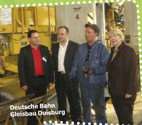
Deutsche Bahn Gleisbau Duisburg