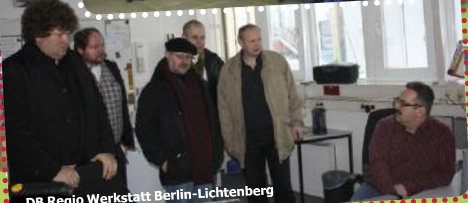
DB Regio Werkstatt Berlin-Lichtenberg